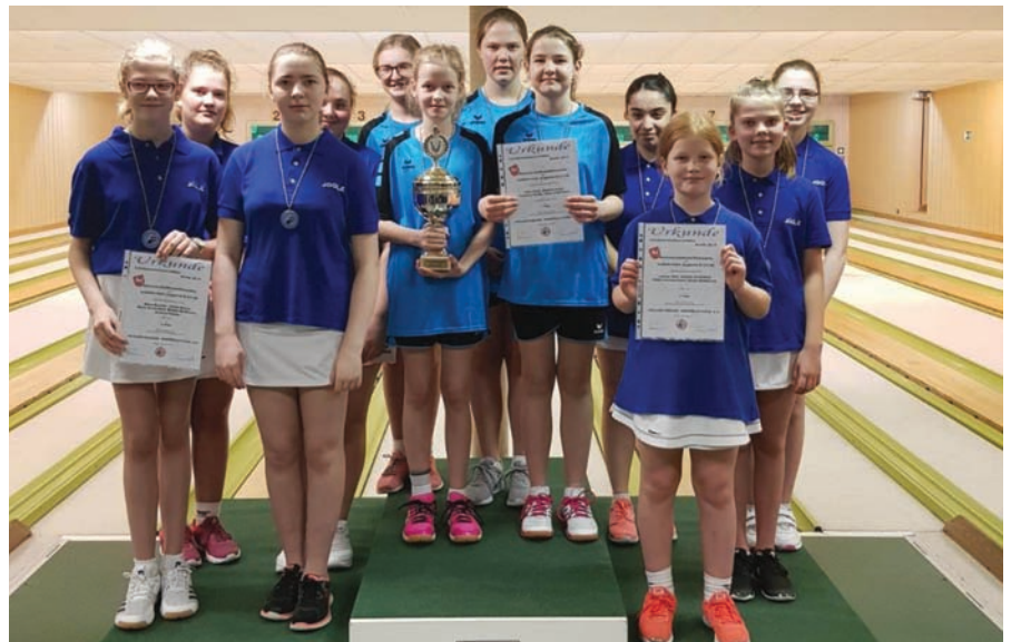
U14 weiblich Mannschaft, v.l.: VCK Celle I, JSG Braunschweiger Land I, VCK Celle II.