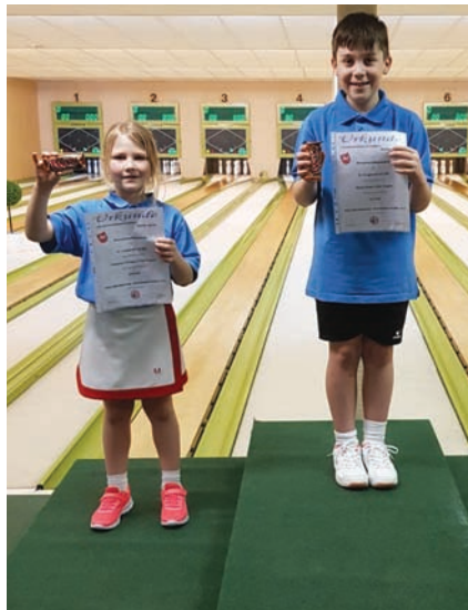
Die U10-Nachwuchstalente freuen sich über Urkunde und Süßes.