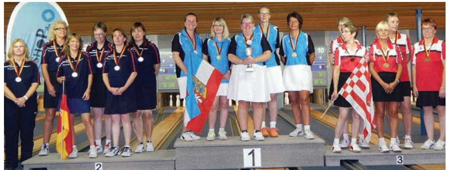
Damen A, v.l.: Niedersachsen, Schleswig-Holstein, Bremen.