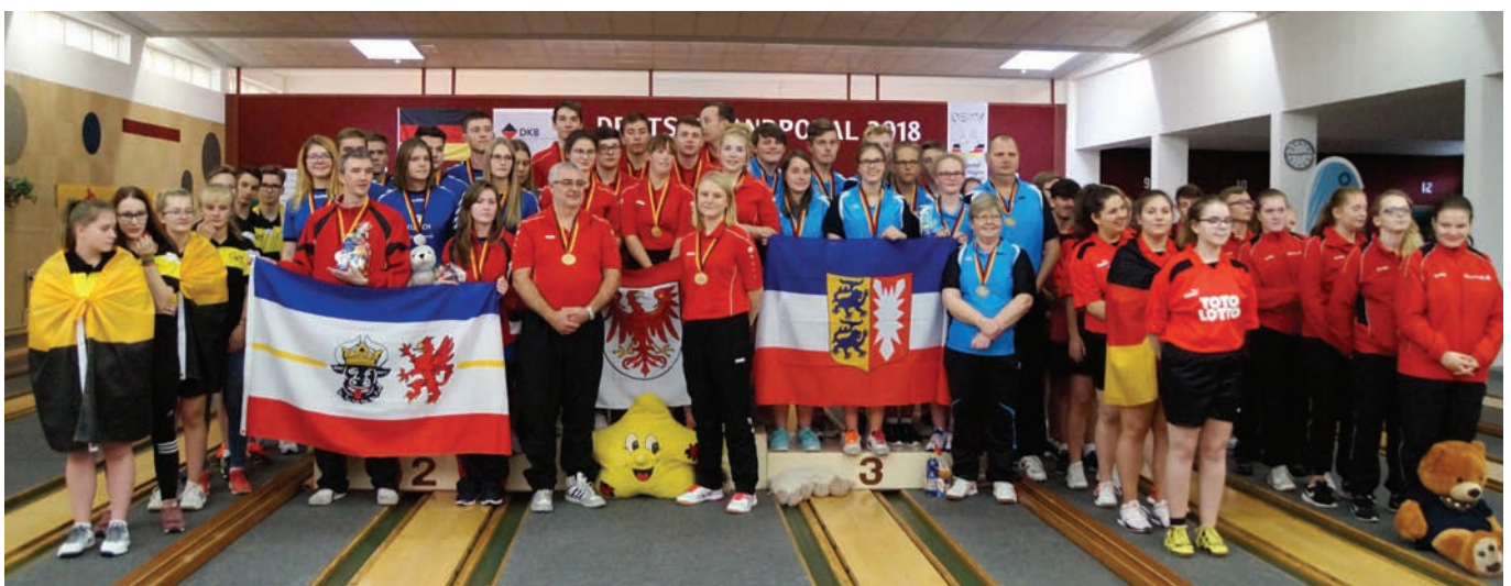
Alle Teilnehmer und Platzierten.

Im Finale um Platz 1 und 2 spielte Mecklenburg-Vorpommern gegen Brandenburg. Beide Mannschaften errangen im Halb-Finale 11 Punkte. Um die Plätze 3 und 4 spielten Schleswig-Holstein