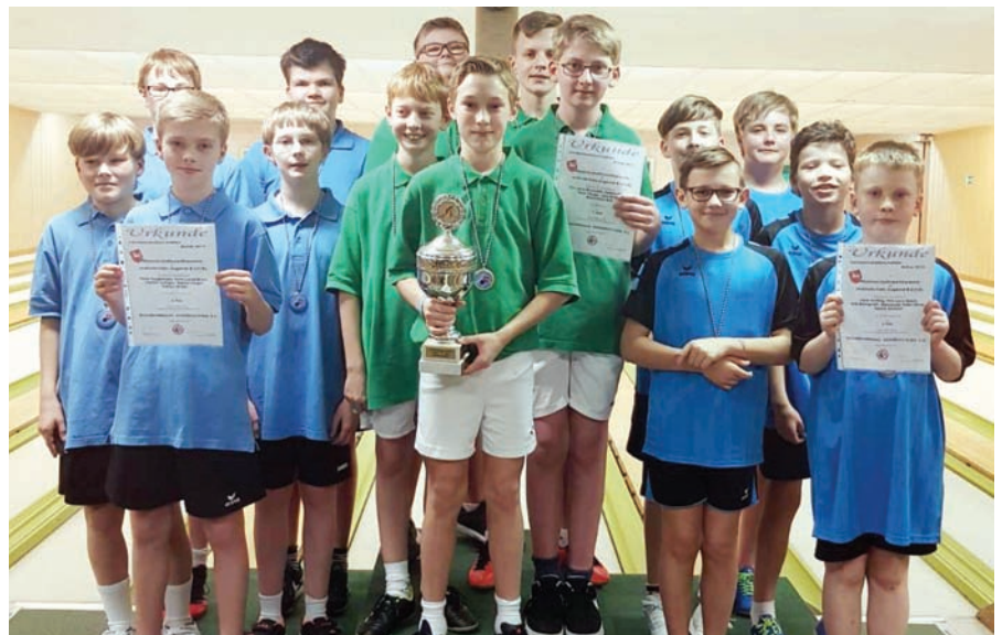
U14 männlich Mannschaft, v.l.: JSG Nordenham/Oldenburg, SKV Bremervörde, JSG Braunschweiger Land.