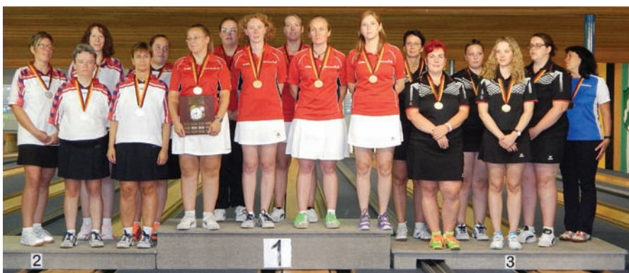
Diese Damenmannschaften schafften es aus Podest, v.l.: Bremen, Berlin, Mecklenburg-Vorpommern.