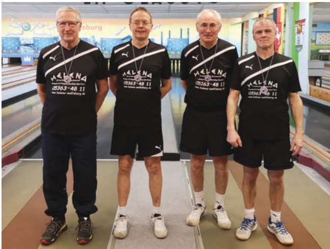
Die siegreiche Senioren-B-Mannschaft des KV Wolfsburg.