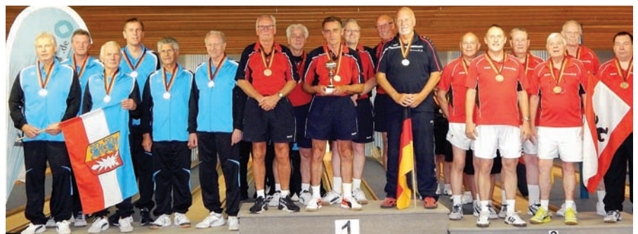
Herren B/C, v.l.: Schleswig-Holstein, Niedersachsen, Berlin.