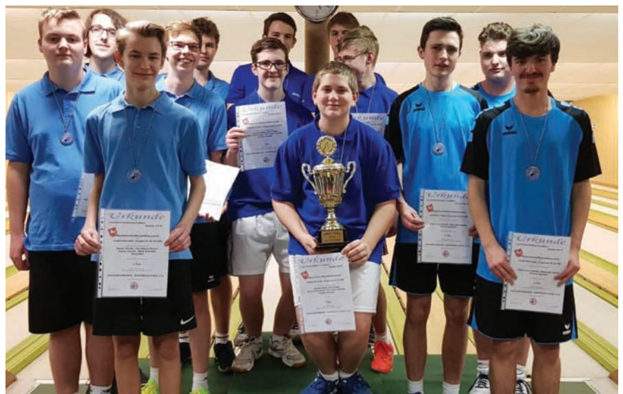
U18 männlich Mannschaft, v.l.: JSG Nordenham/Oldenburg, VCK Celle, JSG Braunschweiger Land.