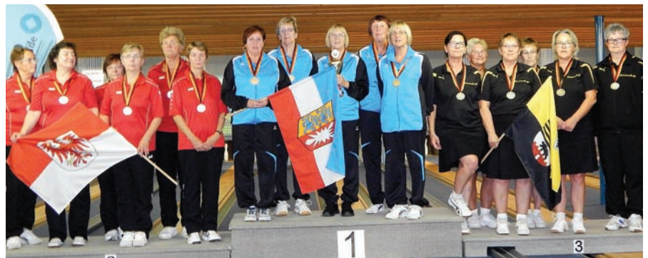
Damen B/C, v.l.: Brandenburg, Schleswig-Holstein, Sachsen-Anhalt.