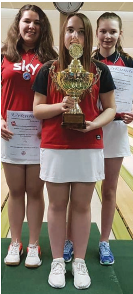
U18 weiblich Mannschaft: SKV Bremervörde.