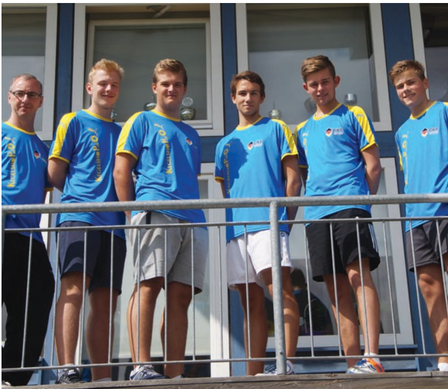
Der männliche U18-Nationalkader.

Im neuen Punktesystem bekamen die Jungen und Mädchen der deutschen Nationalmannschaft pro Spiel 13 Unterpunkte und gewannen mit 52:0 gegen Dänemark. Der Sieg mit 8:0 Punkten hat erneut gezeigt, dass der Kaderlehrgang in Neukloster seine Wirkung nicht verfehlt hat und die Mannschaftsbetreuer eine richtige Auswahl getroffen haben.