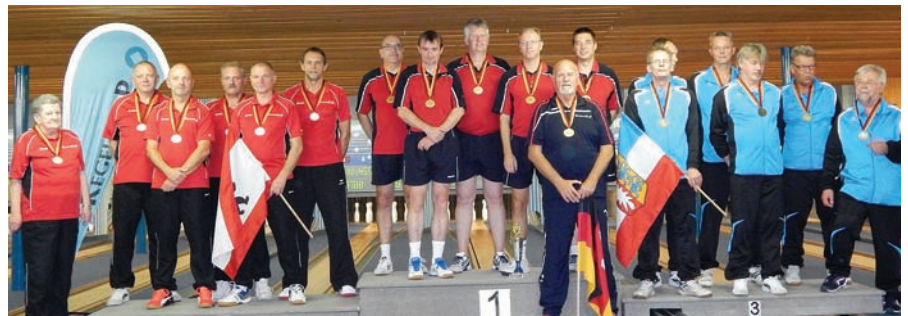
Herren A, v.l.: Berlin, Niedersachsen, Schleswig-Holstein.