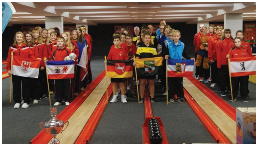
Die beteiligten Mannschaften präsentieren sich bei der Eröffnungsfeier.

Das Spiel um Platz 3 und die Bronzemedaille entschied Brandenburg mit 3:2 Punkten gegen Mecklenburg-Vorpom-