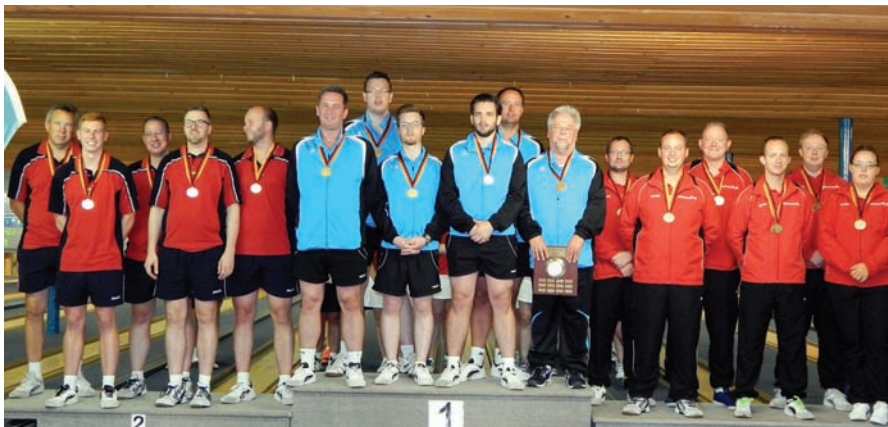
Die Medaillengewinner bei den Herren, v.l.: Niedersachsen, Schleswig-Holstein, Berlin.